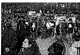
An die 100 TeilnehmerInnen zählte die erste Demonstration von VäterrechtlerInnen in Österreich.

Als einer der Entschlossensten der in den letzten Jahren entstandenen "Väterrechtsbewegung" ist der Vater eines unehelichen Kindes auch Initiator einer Kundgebung, die vergangenen Freitag vor dem Wiener Parlament über die Bühne ging. Geschätzte 100 TeilnehmerInnen demonstrierten dort mit Unterstützung der FPÖ für Änderungen im Familienrecht, welche von Väter-Seite als besonders diskriminiert eingestuft werden. Gefordert werden u.a. Sanktionen bei Besuchsrechtsverletzungen durch den anderen Elternteil, die Einführung der Gemeinsamen Obsorge als gesetzlichen Grundtatbestand sowie die Straffung der Obsorge- und Besuchsrechtsverfahren.